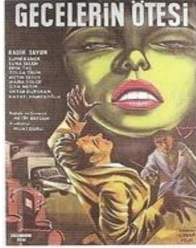
Afiş 3: “Toplumsal Gerçekçilik Akımının İlk Örneği: Gecelerin Ötesi”.

Toplumsal gerçekçilik akımının önemli örneği kabul edilen, Metin Erksan’ın Gecelerin Ötesi filmi 27 Mayıs darbesinin yarattığı hava neticesinde yapılmıştır. İlk kez bir toplumsal eleştiri yapılan filmde ortak çevre olarak; mahalle, ortak eylem olarak; soygun, ortak endişe olarak; ezilmişlikten meydana gelen bunalımı merkeze alarak, bireylerin içsel sebeplerinden toplumu şartlandıran sonuçlar üretmiştir (Atayeter, 2012). Erksan, filmin çıkış hikayesini şu şekilde aktarmıştır: