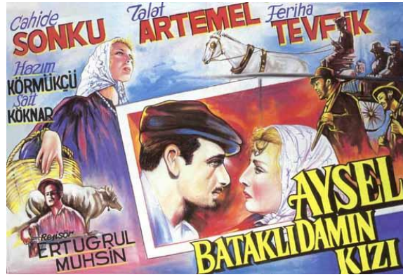
Afiş 2: “İlk Köy Filmi: Aysel, Bataklı Damın Kızı” (İnanoğlu, 2017).