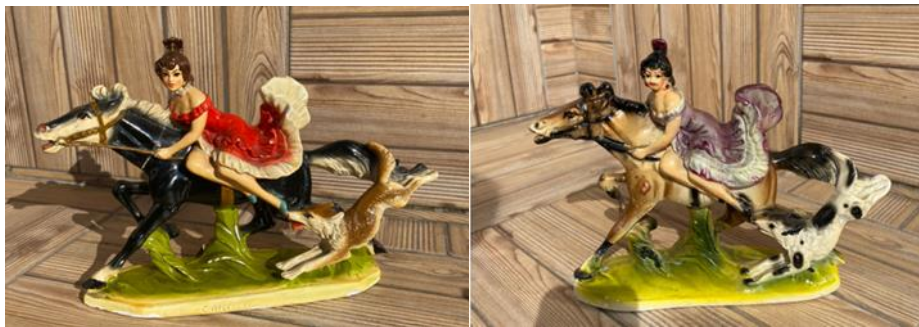
Photos 7 and 8: Twin models in different colors, probably coming from different casts.

It is highly probable that during a long span in Türkiye, as in the other parts of the World the replicas of replicas were produced as mentioned above because today it is still probable to come across unevenly detailed figurines and most of the second generation replicas are unstamped. Also, the most well-known ones could vary in colors and details. For example, the two depicted in the visuals below belong to the same figurine model but the striking change in the painting details and the apparent physical differences can be detected in the same model. See image 7 and 8 below.