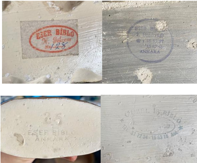
Photos 11, 12, 13 and 14: Stamping at the bottom of te pedestals.