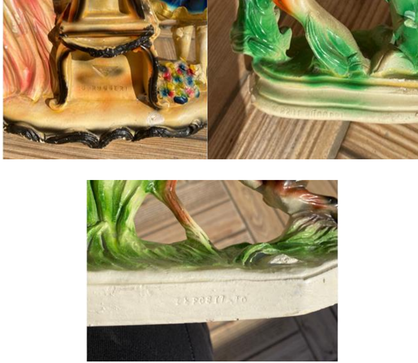
Photos 8, 9 and 10: Inscriptions at the back pedestals.

And it is quite frequent that a triangular cold print accompanies G. Ruggeri figurines while it is highly visible that Santini figurines don't have a cold stamp or a symbolic print of a specific company. But it is often the case that many of the figurines have been polished to prevent it from having damages and enable it to present the color which has mostly made them cover the already faded inscriptions on the plinths.