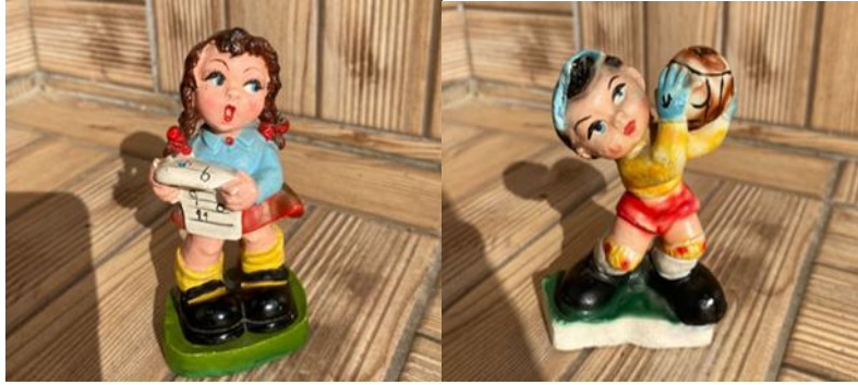
Photos 5 and 6: Exaggerated body proportions in the plaster figurines.

And male adult figures depicted alone is rare but also seemingly a period came in the late span of production depicting male children and grown-up with various occupations and standing by/holding various object like balls, buckets, umbrellas, hats, etc. Bu this genre is often depicted with an odd body proportion with an object by the side as available in the images below.