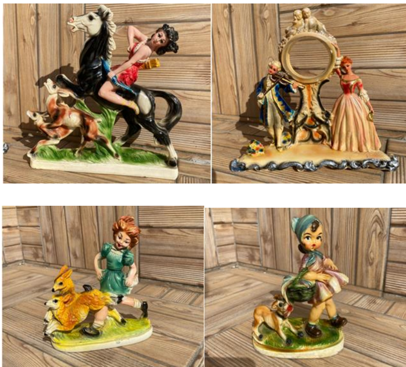
Photo 1, 2, 3, 4: Various models of chalkware figurines.

Plaster molds, made of two parts, were oiled to prevent the plaster mold from adhering to the casting. Rubber bands or rope (never a clamp) were used to hold the pieces of the mold together. This allowed for some separation of the mold in response to the heat and expansion that is created while the plaster casting sets. A limited amount of plaster was poured into the mold, which was rotated until the plaster hardened. After disassembly of the mold, the parting line on the cast was removed with a sharp tool. Early chalkware was painted with oil paint, but watercolors in bright primary colors ultimately gained dominance (O'Banion and Cole, 2011). One of the basic physical characteristics of the figurines in question can also be enlarged with the category of having a pedestal painted in a vivid green color- mostly pictured as the green grass or representing the characters' being in open air- and coming with a versatility in the animal and human figures depicted. The scale of the character representations varies from ice skating couples to amazon women hunting. The depiction of horses, deers, dogs or a simple everyday object like a bucket, ball, umbrella, etc. accompanying ladies is highly prevalent.